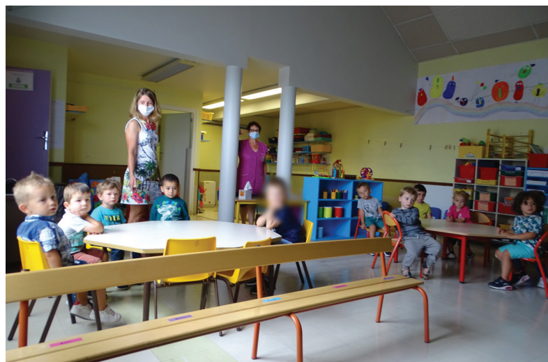
Travaux d'été : la classe des maternelles, PS/TPS, a été aménagée par les services techniques pendant cet été avec la suppression d'un escalier donnant sur la mezzanine et la peinture des étagères de la classe.