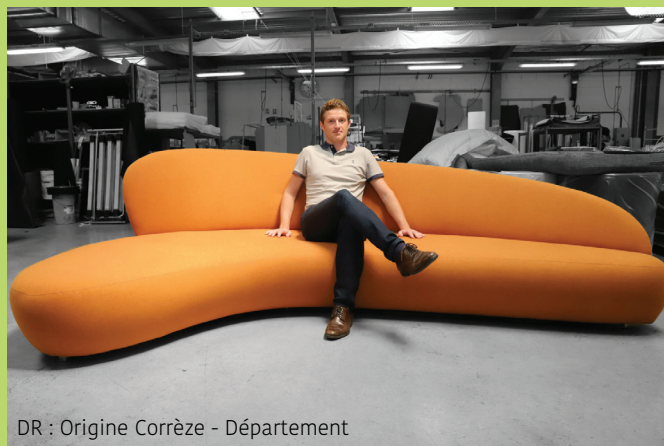
DR : Origine Corrèze - Département

L'entreprise a récemment représenté la Corrèze lors de l'exposition sur le Made in France qui