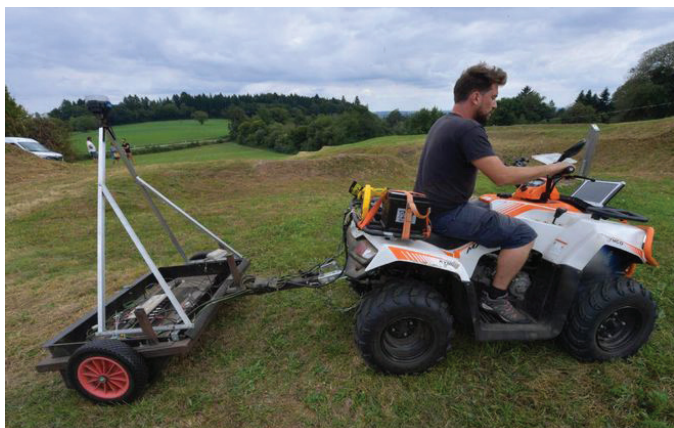
prospection geophysique sur le site de Tintignac à Naves

Non rassasiés des visites, ils étaient nombreux après les commentaires à déambuler sur le site, relisant à l'envi les tableaux permettant d'imaginer ce qu'était Tintignac il y a plus de 2000 ans. À l'année prochaine pour de nouvelles aventures !