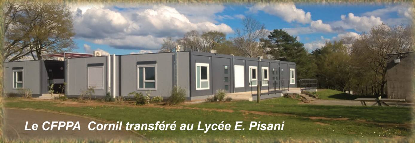
Le CFPPA Cornil transféré au Lycée E. Pisani