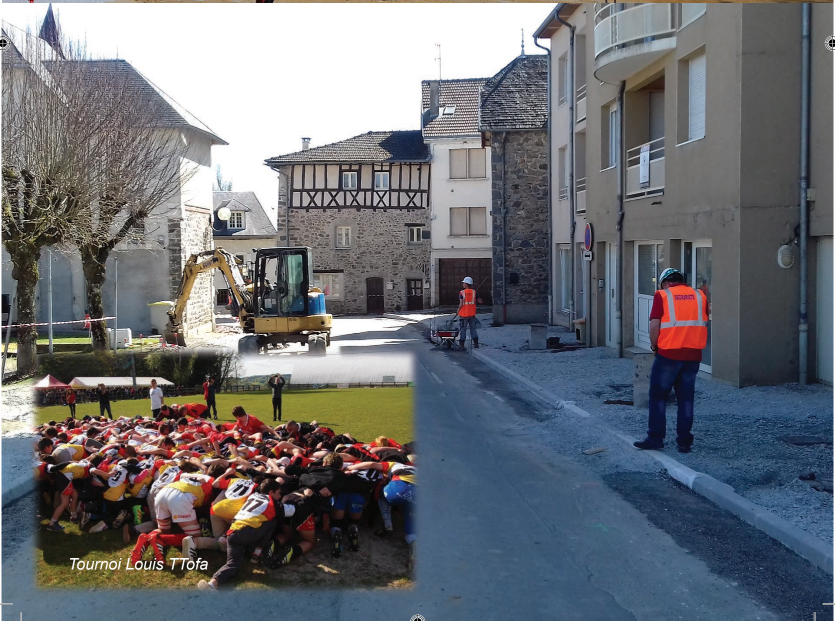
Tournoi Louis TTofa