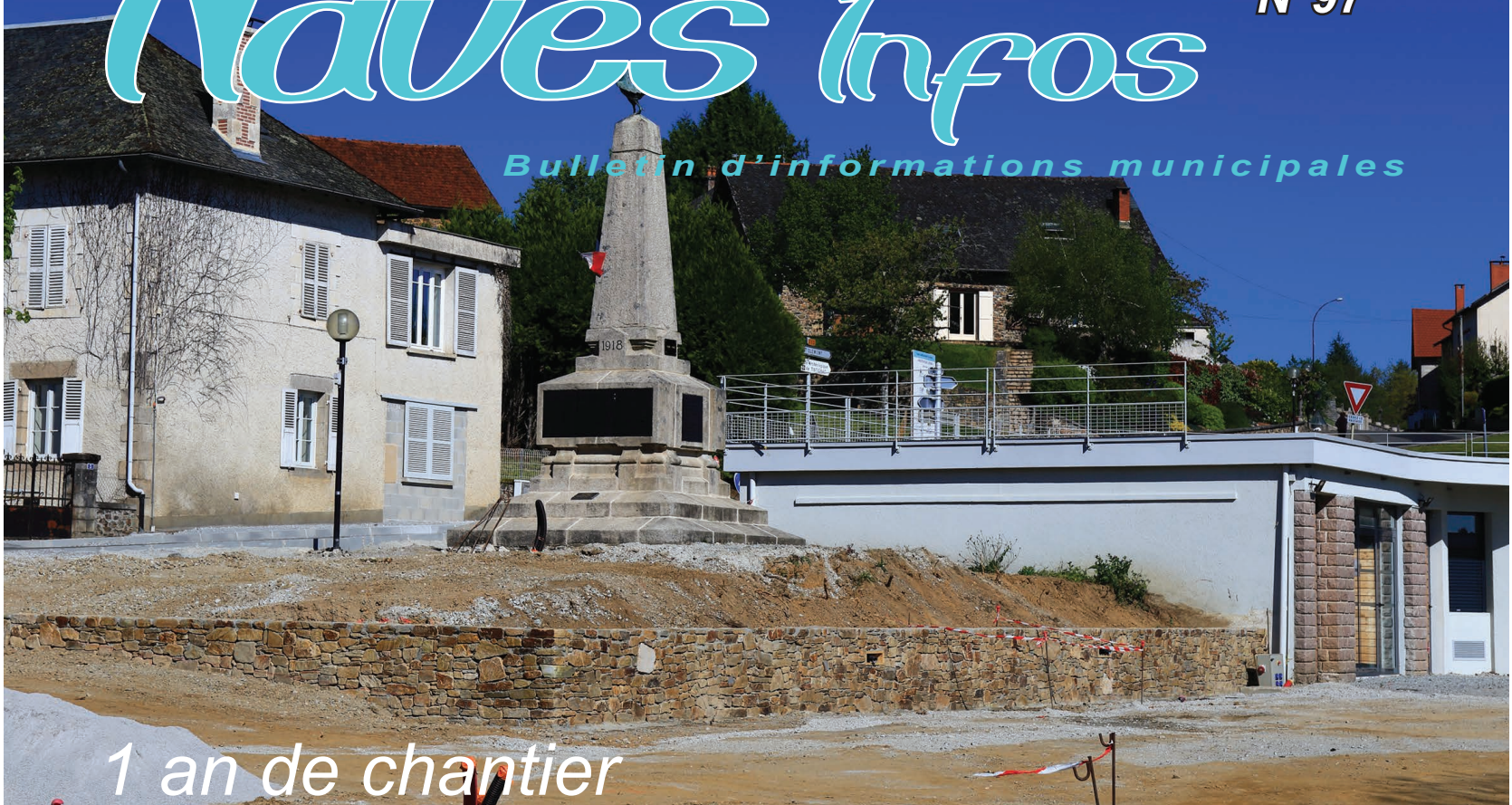
1 an de chantier