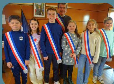
Les élus du conseil municipal des jeunes 2025-2026